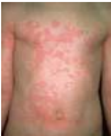
Reazione allergica cutanea

Si tratta di un rischio prevalentemente legato alla lavorazione del pesce, delle farine e dei mangimi da questi ottenuti. I lavoratori a seguito dell'esposizione a questi allergeni possono contrarre una malattia professionale che può dar luogo a diverse reazioni che vanno dall'orticaria, alla rinite o congiuntivite, all'asma, fino a reazioni gravi come lo shock anafilattico.