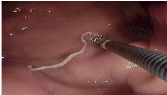
Rimozione della larva dalla regione gastrica con endoscopio

Terapia: essenzialmente di tipo chirurgico nelle forme con ascessi e granulomi, endoscopica per l'asportazione del verme tramite gastroscopio o colonscopio con pinze da biopsia. La terapia farmacologica con antielminti è di discussa efficacia e determina inoltre effetti collaterali importanti. Si ricorre ai cortisonici solo per ridurre l'edema e far regredire il fenomeno occlusivo.