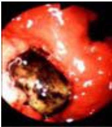
Mucosa gastrica cancerizzata

cronica : legata alla risposta dell'ospite alla penetrazione della larva nella mucosa intestinale che avviene a seguito della produzione di potenti proteasi e altre sostanze ad azione anticoagulante. La risposta infiammatoria determina la formazione di granulomi eosinofili, lesioni ascessuali, ulcerazioni, necrosi, infiltrazione eosinofila che possono condurre all'occlusione intestinale fino alla perforazione dell'intestino e dello stomaco;