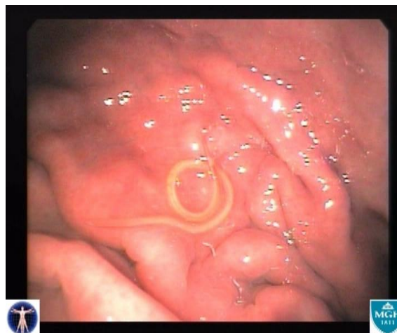
localizzazione gastrica di Anisakis