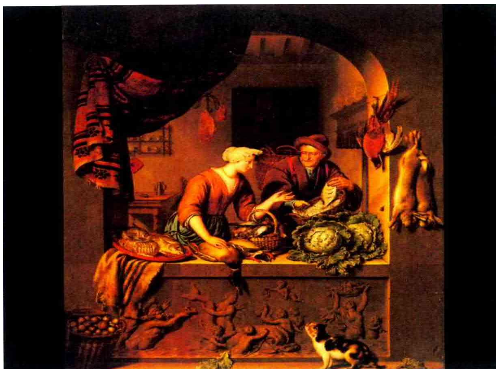
Venditore di pesce (Willem van Mieris, National Galleri 1713)