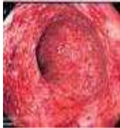
gastro - entero - colite eosinofila

ectopica: contempla la possibilità di riscontrare la larva in sede extragastrointestinale, cavità addominale, parete addominale, mesentere, grande omento, fegato, pancreas, polmone, linfonodi, sottocute, con possibili granulomi, ascessi, quadri occlusivi.